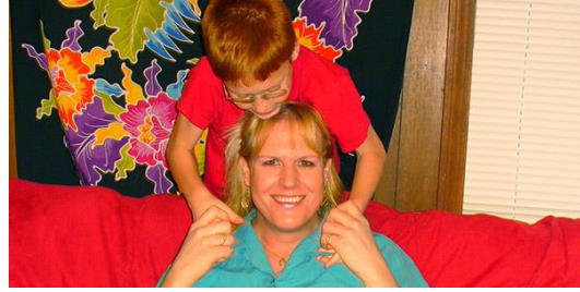
Figura 3. Proyectos de Diversidad Familiar. Voces Pioneras.

La escuela no está enseñando creencias religiosas. Por el contrario, estamos enseñando sobre el respeto por la diferencia humana, que es un valor común a través de muchas comunidades de fé. Por ejemplo, en ARMS enseñamos una unidad sobre las religiones del mundo en los estudios sociales del 7º grado. En esa unidad no enseñamos a los estudiantes a practicar religiones específicas, sino que enseñamos sobre el papel de la religión en la sociedad, la historia y la cultura. Al enseñar nuestro plan de estudios Asesor con esta exposición fotográfica: Retratos de Personas Transgénero, estamos profundizando nuestro aprendizaje para entender mejor nuestro mundo y hacernos ciudadanos más comprometidos a través de la apreciación de la diversidad de las personas que crean nuestra comunidad única.