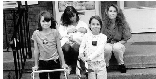
Figura 1. Proyectos de Diversidad Familiar, Inc. En Nuestra Familia.

Family Diversity Projects muestra el texto impreso de las entrevistas con las personas en las fotos. La fusión de la imagen y el texto hace hincapié en las voces de los individuos en las fotos, en un esfuerzo por ayudar a los espectadores a acercarse a la comprensión de las experiencias de los que se retratan en la exposición. Ver su sitio web en: https://familydiv.org/ .