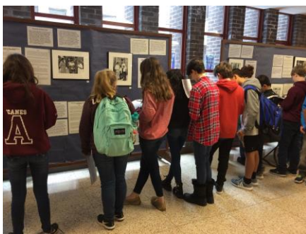
Figura 2. Cada Grupo de Asesoría estudia la exposición.

ser una familia" con esa exhibición titulada, " In Our Family ". Representó muchas maneras diferentes en las que las familias son formadas y experimentadas ya sea a través de la adopción, el nacimiento, el cuidado de crianza temporal y otras relaciones de cuidado. La exhibición retrató a familias encabezadas por dos padres, padres solteros, abuelos, así como padres con una variedad de habilidades / discapacidades, padres de sexo opuesto, miembros del mismo sexo y familiares que demuestran muchas otras experiencias de diferencia humana. Durante los meses de enero y febrero, cada Grupo Asesor visitó la exposición tres veces y participó en una serie de actividades curriculares para cumplir con el objetivo de aprendizaje: "Los estudiantes podrán discutir con respeto a las familias y miembros de la familia". Puedes ver algunas de las fotos de esa exhibición en este enlace: https://familydiv.org/exhibits/in-our-family/